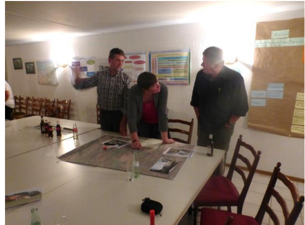
DorfbewohnerInnen in der Diskussion untereinander